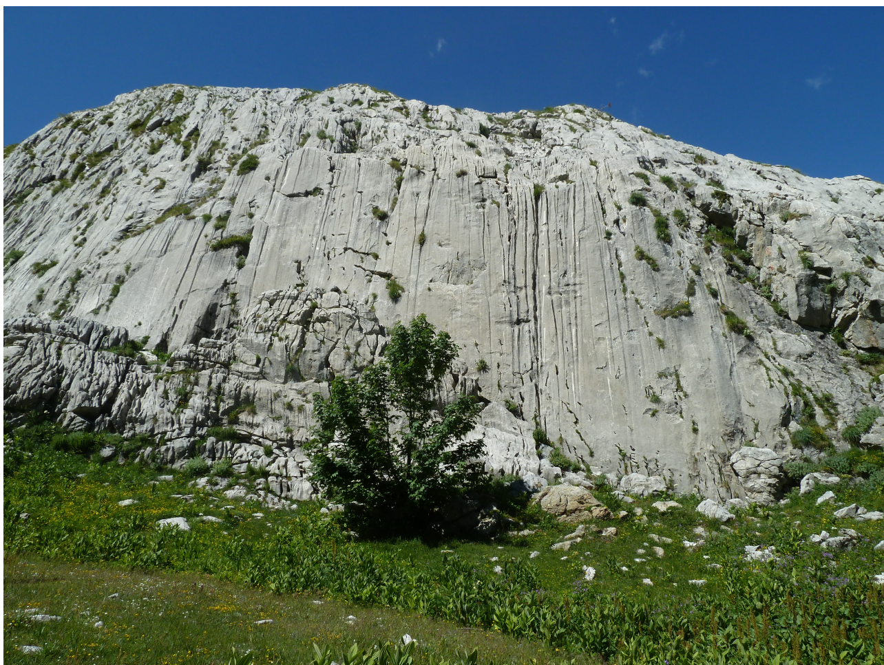
IL MOON WALL ILLUMINATO DAL SOLE IN UNA MATTINATA ESTIVA

Accesso: RAGGIUNGERE RASTELLO IN VAL ELLERO E PROSEGUIRE ATTRAVERSANDO PONTE MURATO FINO ALLA SBARRA DI PIAN MARCHISIO A 1634M. LASCIARE L'AUTO E PROSEGUIRE SULLA MULATTIERA FINO A AL BIVIO PER IL RIFUGIO MONDOVÌ E SEGUIRE A SINISTRA LA DEVIAZIONE PER IL GIAS GRUPPETTI FINO A RAGGIUNGERLO, SEMPRE SU EVIDENTE MULATTIERA, A QUOTA 1882M. DI QUI INSINUARSI NELL'EVIDENTE FONDOVALLE ERBOSO E RICCO DI CALCAREI "CAMPI SOLCATI" FINO REPERIRE SULLA DESTRA LA BARRA ROCCIOSA SULLA QUALE APPAIONO EVIDENTI GLI SPOT E LE LINEE DI ARRAMPICATA.(1H20' DAL PARCHEGGIO, POCO DISLIVELLO PREVALENTEMENTE SU STRADA STERRATA. E' MOLTO PRATICO L'ACCESSO CON E-BIKE)