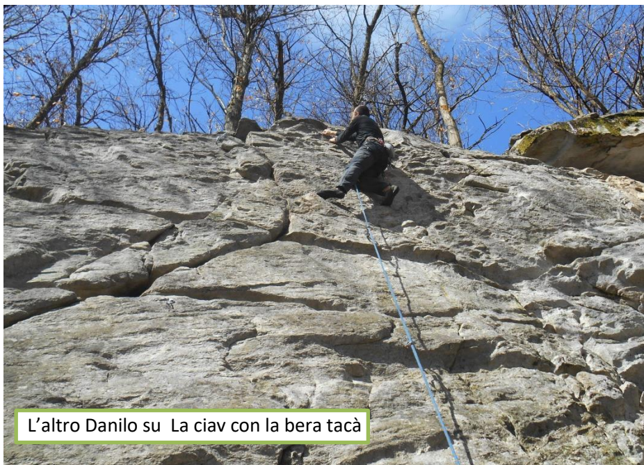
L'altro Danilo su La ciav con la bera tacà