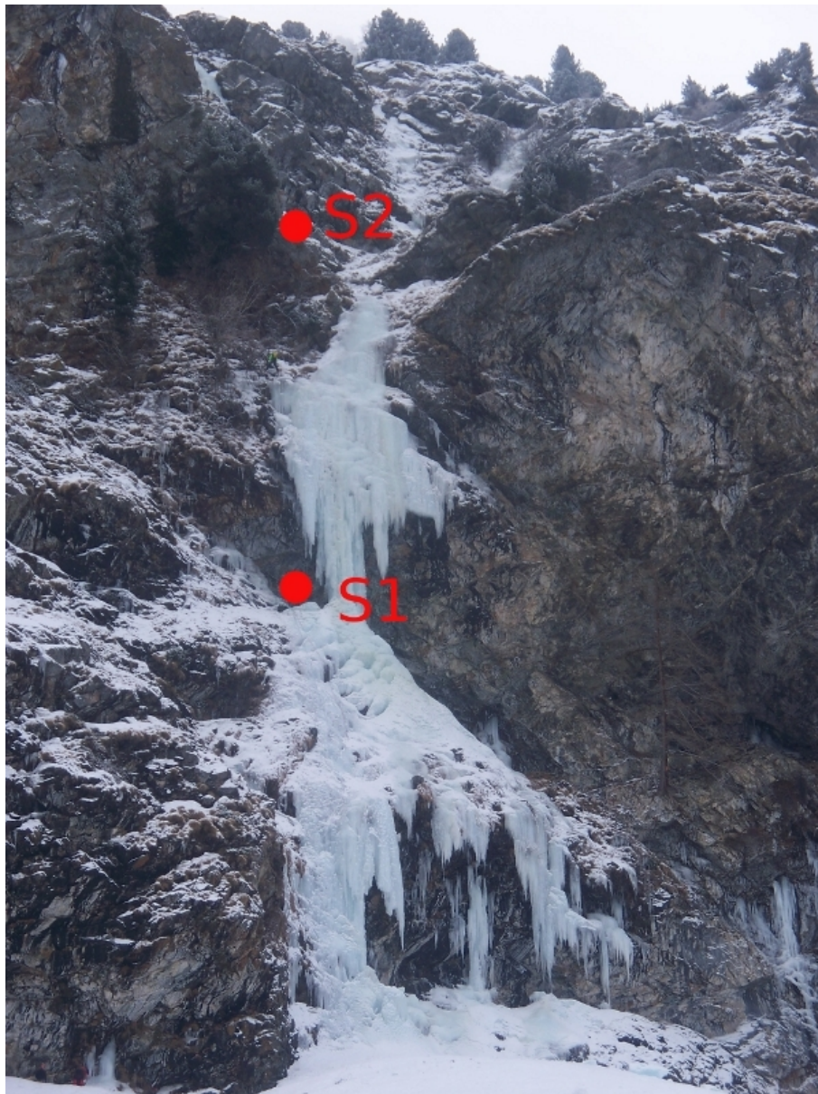
La prima parte della colata