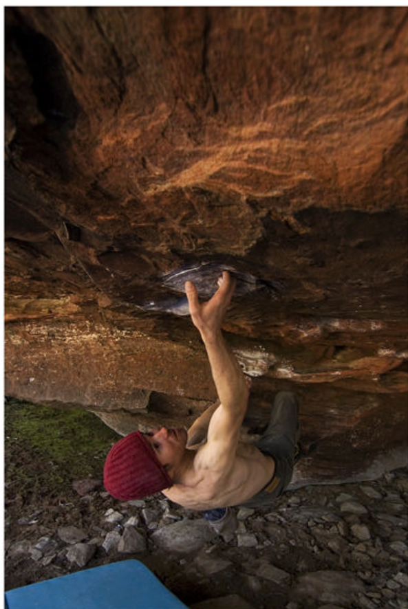
Il Ninio su Eclipse (7B), settore Techos

Proprio a Techos il Ninio sale flash un problema di 7b chiamato Eclipse. Una decina di movimenti sotto a un tetto di 90° con difficile ribaltamento. Antonio segue dopo qualche tentativo.