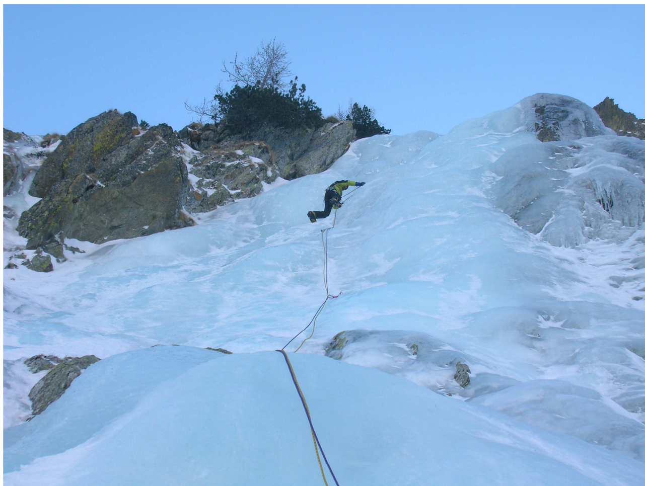
Lo stesso tiro in due annate differenti