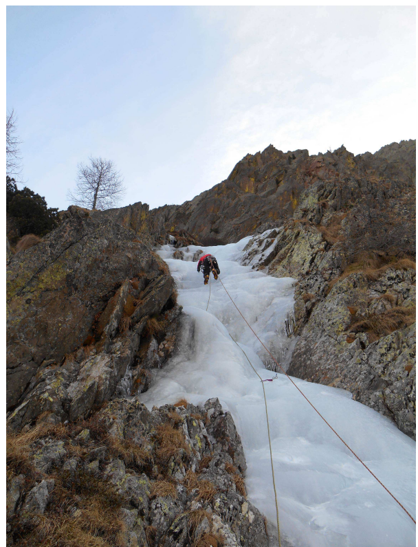
Secondo tiro di Buij