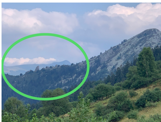
LA CRESTA DEL MONTE MERDENZONE CON I DEI DENTI DLA VEJA VISTI DALLA ZONA DEL COLLE DEL PREL

N.B. L'ARRAMPICATA È UNO SPORT POTENZIALMENTE PERICOLOSO E LA ROCCIA E LE PROTEZIONI FISSE IN AMBIENTE NATURALE POSSONO SUBIRE MODIFICHE STRUTTURALI ANCHE IMPORTANTI DURANTE LA LORO SOLLECITAZIONE O CAUSA DI EVENTI NATURALI; PRESTATE DUNQUE SEMPRE UN'ATTENZIONE CRITICA A TASSELLI, APPIGLI, APPOGGI E A EVENTUALI BLOCCHI O STRUTTURE INSTABILI. RICORDATE CHE LA SICUREZZA PARTE DA VOI STESSI. E' CONSIGLIATO IL BETA STICK PER I PRIMI RINVII.