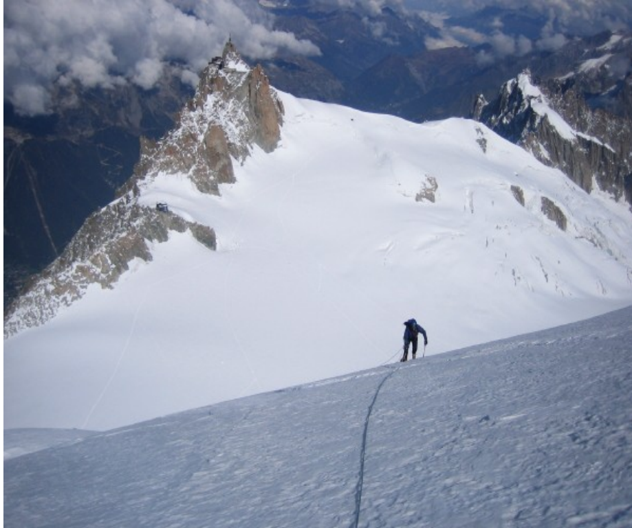
Uscita in cima al Triangle

Se qualcuno è in grado di fornirci ulteriori informazioni, migliorie o eventuali correzioni alla presente relazione è pregato di scrivere a info@cuneoclimbing.it .